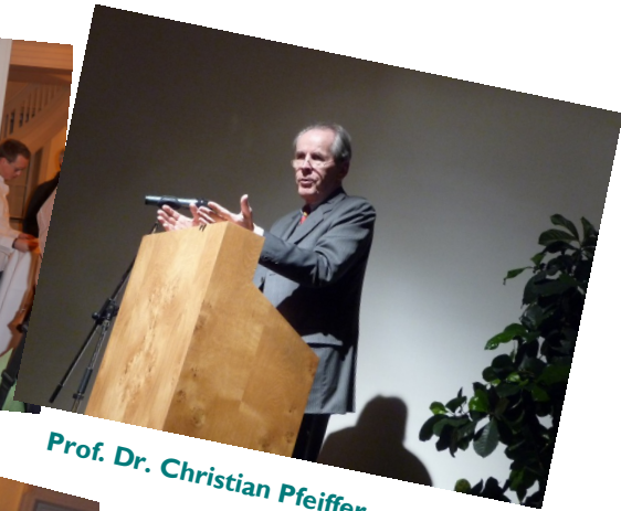
Prof. Dr. Christian Pfeiffer