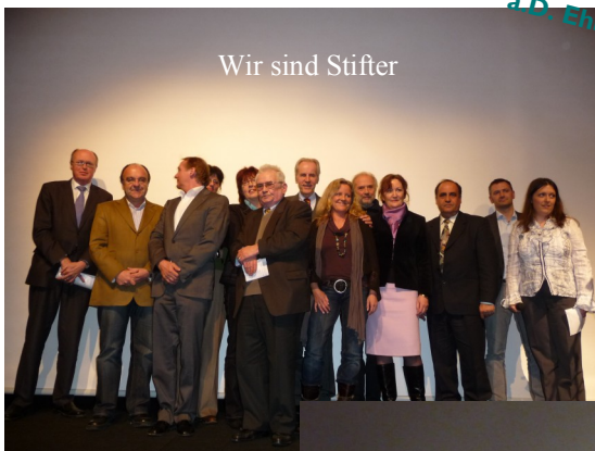
Wir sind Stifter